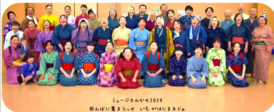
ミュージカルかぞ2024 田んぼに集まらせ いちかはじまるぞ

次回は、本公演10回目の節目として「いち」を7月14日(日)、15日(月・祝)で予定されています。まだ観たことがない加須市民の方はぜひチケットを手に入れて観に行かれてみませんか？