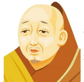
足利義満 イラストAC (T.H作)から