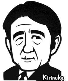
安倍晋三元首相 キリヌケ成層圏 (加藤タカシ作)から