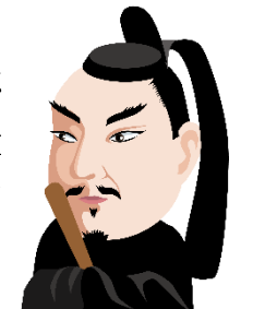
徳川家光