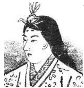
皇極（斉明）天皇 御歴代百廿一天皇御尊影から