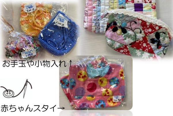
お手玉や小物入れ↑

パッチワークで作る作品以外にも、編み物や縫い物で作った作品など、いろいろな種類の作品を出品しています。赤ちゃんが使える物から大人が使える物までさまざま出品しています。ぜひ、手に取ってご覧になってみてください。