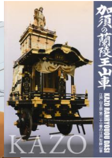
来年観ることができます。蘭陵王山車