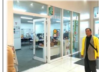
入間市市民活動センター 「イルミン」 (公設民営)

大きなショッピングモール街の中にある桶川市市民活動サポートセンター。情報提供の具体的な手段のヒントを得た。