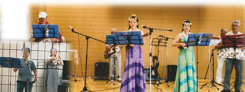
月曜夜の練習風景