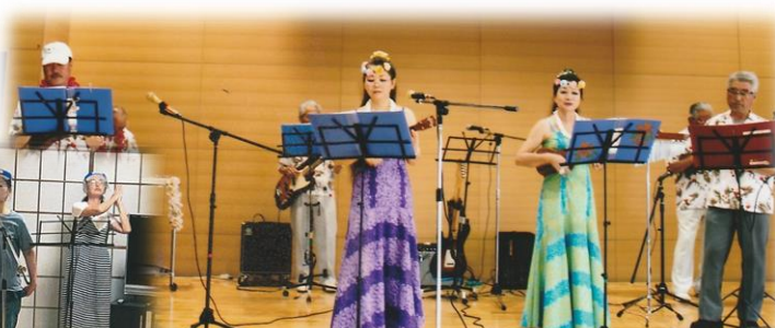
オリオリ・メレフラ