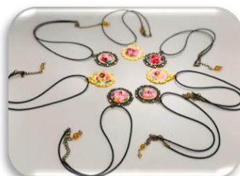
癒しの香り絵と 香りアクセサリー