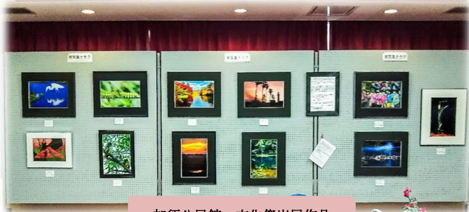
加須公民館 文化祭出展作品

各コンクールにメンバーたちと作品を出展されています。加須市主催の「ふるさと写真コンクール」では市長賞・議長賞・優秀賞を総嘗めし、「埼玉県北美術展」では5名入選し、そのうち1名は入賞されたそうです。