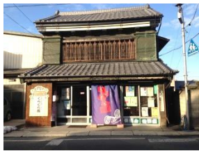
築100年の蔵造りの建物

これから皆様のお役に立てるようスタッフ一同精一杯頑張らせていただきますのでどうぞよろしくお願いたします。